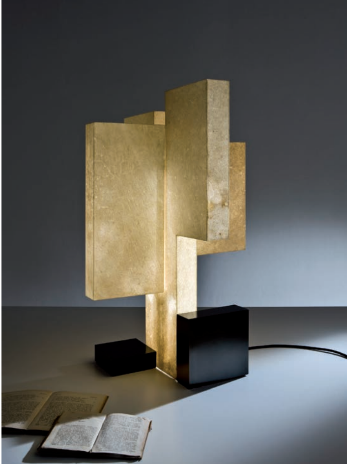
Table lamp with base in burnished brass, diffuser covered in goat parchment and four internal LED strips.

With a simple design and an articulated volume, it represents a tribute to the artistic avant-gardes of the 1930s.