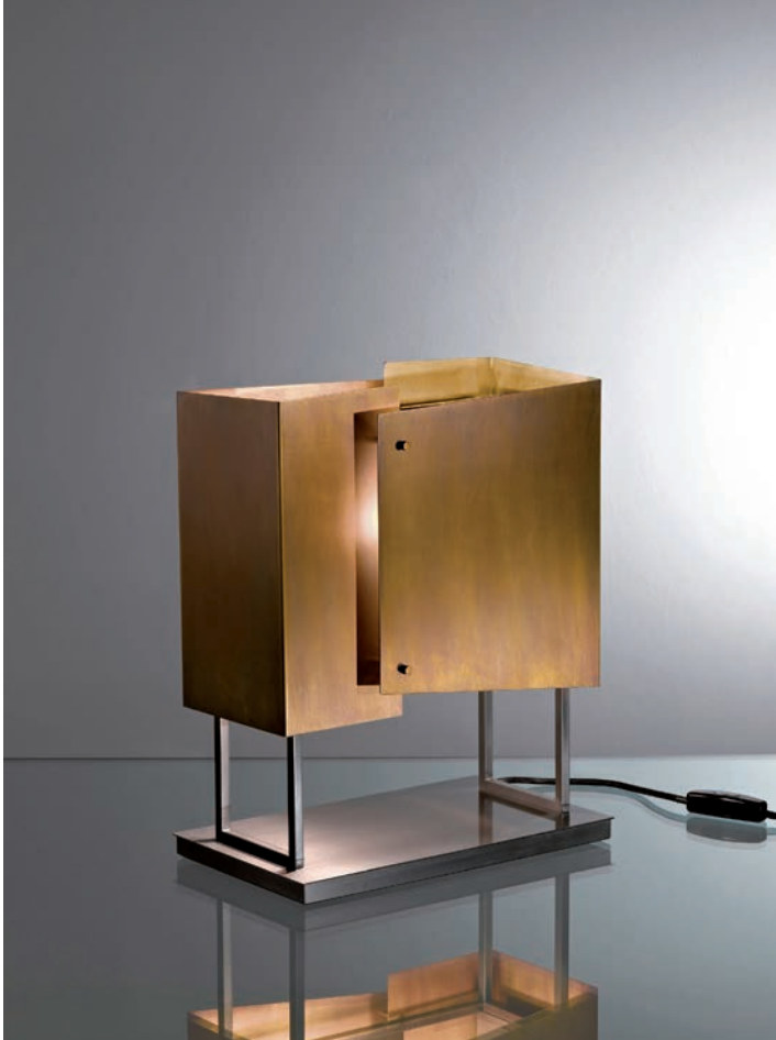
Table lamp in black nickel-plated brass and lampshade in burnished brass.

The attention to detail and the exclusively manual processing of the burnished brass enhance the lamp, creating a highly decorative product.