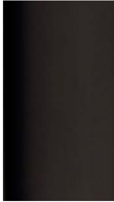
Pewter finish steel