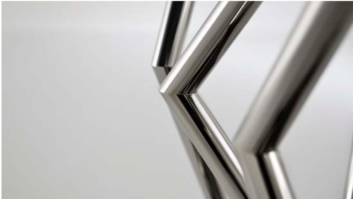
Table with steel base and extra-clear glass top.

Base available in polished steel or in steel with pewter finish.