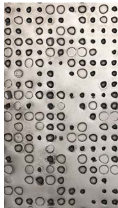
Liquid Metal Tin

_The finishes shown are indicative and refer to the entire production range. Laurameroni reserves the right to modify the range without warning.