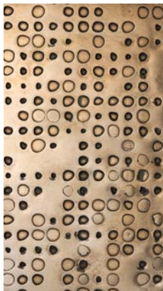
Liquid Metal Bronze

_materials & finishes for the doors Unlimited liquid metal