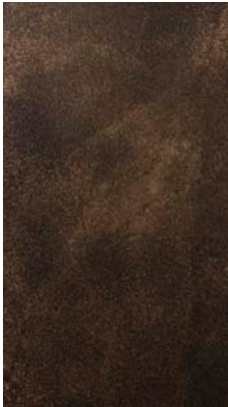
"Patina bronzata antica"