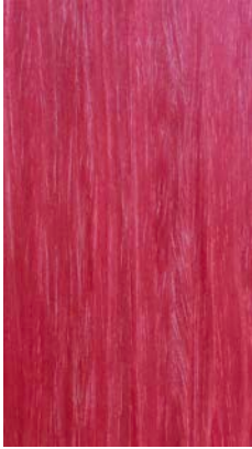
Maple red aniline dyed

_The finishes shown are indicative and refer to the entire production range. Laurameroni reserves the right to modify the range without warning.