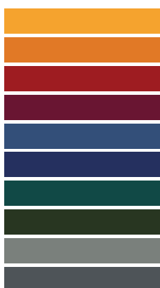
Available in all RAL / NCS colors

_The finishes shown are indicative and refer to the entire production range. Laurameroni reserves the right to modify the range without warning.