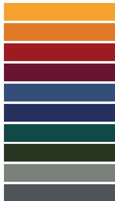
Available in all RAL / NCS colours

_The finishes shown are indicative and refer to the entire production range. Laurameroni reserves the right to modify the range without warning.