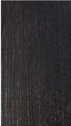
Stone Oak 'Carbone'