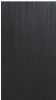
Brushed matt lacquered