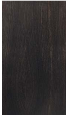
Stone Oak 'Tabacco'