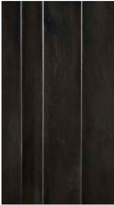
Black Iron "Genere"