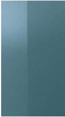
High gloss polyester

_materials & finishes for the desk and the back panels lacquering