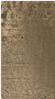
Liquid Metal Bronze