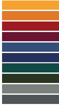
Available in all RAL / NCS colours

_The finishes shown are indicative and refer to the entire production range. Laurameroni reserves the right to modify the range without warning.