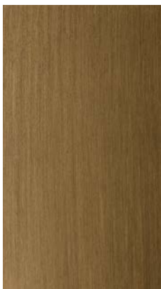
Brushed lacquered "Gold"