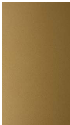
Matt lacquered "Gold"

_The finishes shown are indicative and refer to the entire production range. Laurameroni reserves the right to modify the range without warning.