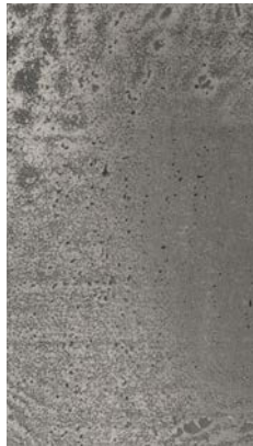
Liquid Metal Tin

_materials & finishes for the desk and the back panels